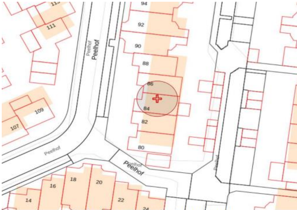
BIJLAGE BIJ VKB 24027 GPP Peelhof 84, 5709BN Helmond