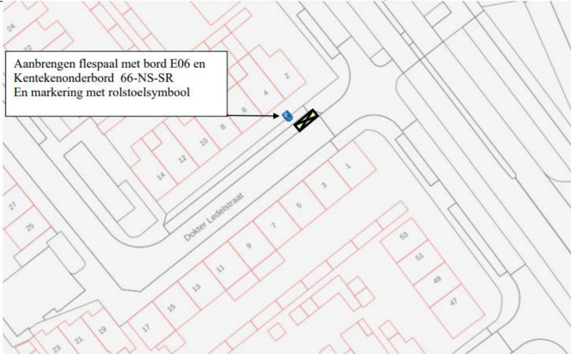
BIJLAGE BIJ VKB 25012 GPP Dr.Ledelstraat 4, Helmond

Aanbrengen flespaal met bord E06 en Kentekenonderbord 66-NS-SR En markering met rolstoelsymbool